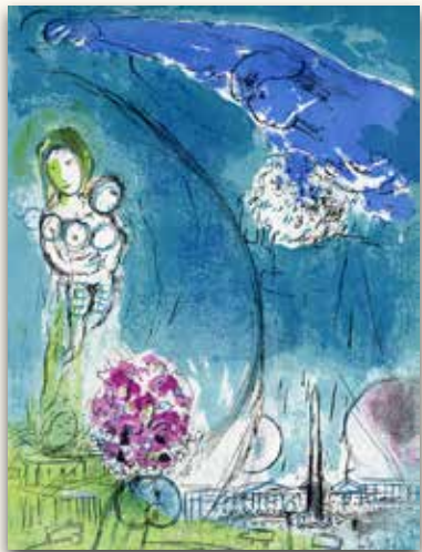
Marc Chagall, Original Farblithographien aus Revue Verve von 1952 und 1960, Format 35 x 26 cm „Place de la Concorde“ € 1.500,-