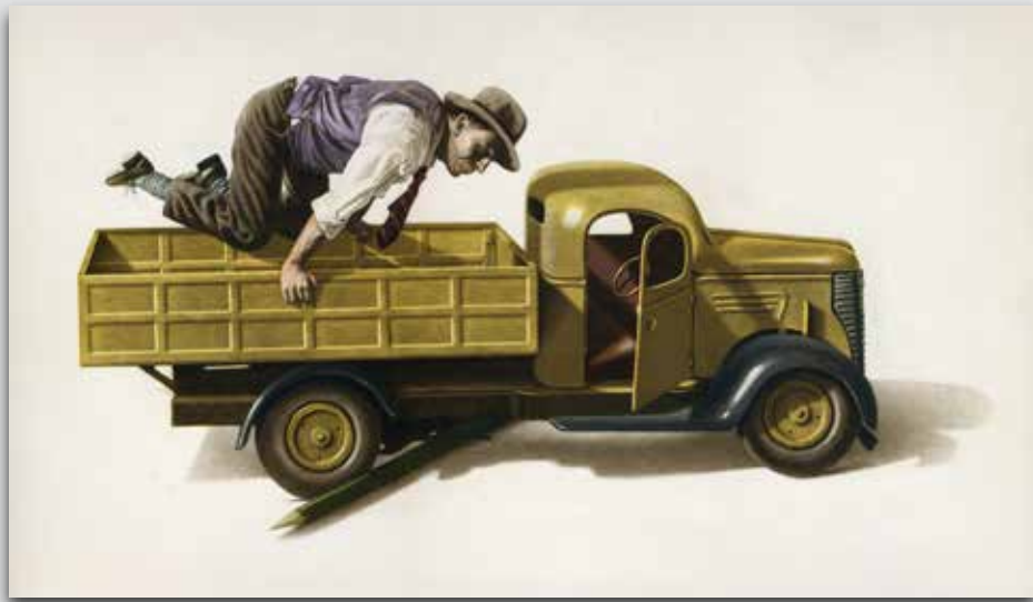
Sauve qui peut 1994 - Radierung in 3 Farben, Auflage 50 Exemplare, Format: 34 x 51 cm, Signiert € 1.200,-