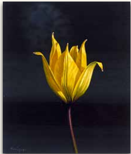
Gelbe Tulpe 2001 - Unikat, Gouache und Acryl auf 600 g Fabriano Karton, Format: 17 x 15 cm € 1.800,-

Aus der Serie „Das Spielzeug“ von Jan Peter Tripp: