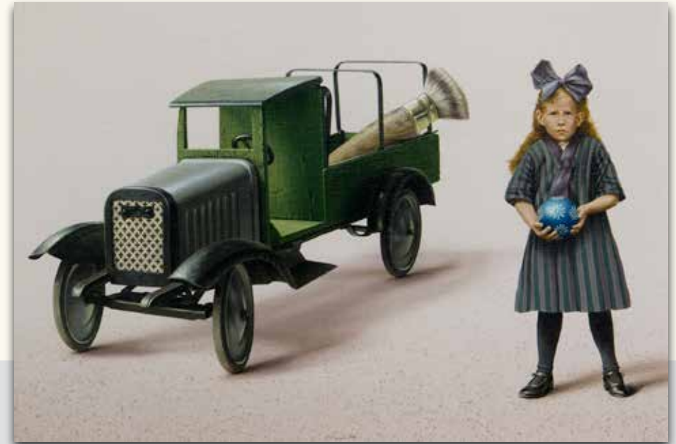
Westerwald 1994 - Unikat, Acryl auf Leinwand/Holz, Format. 35 x 50 cm, Signiert € 12.000,-

„Vernutzt, zerschissen, Rost & Dreck, Speichel & Schweiß - Bettwärme & Mülltone. Gefährten der eigenen Sprachlosigkeit, Weggenossen der Introversion, alle mißbraucht in kindlichem Suchen nach Inventarisierung der Welt. Vernutzt, zerschissen und dann aus dem Auge aus dem Sinn.“