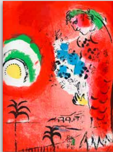
„Bucht der Engel“ € 1.200,-