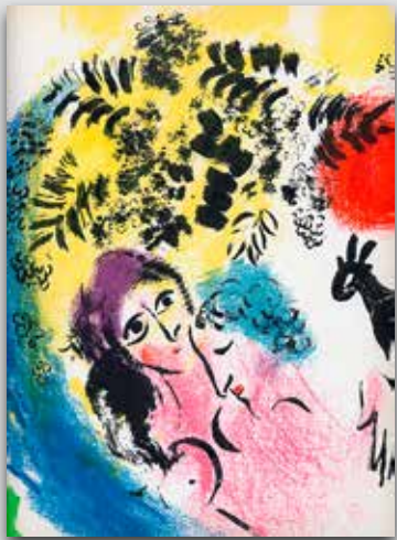
Marc Chagall, Original Farblithographien (32 x 25 cm) aus Lithograph I von 1960 „Verliebte mit roter Sonne“ € 1.200,-