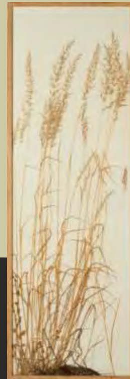
herman de vries: Rasenstück object taken from nature