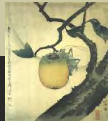
Hokusai: Moon, Grasshopper and Persimmon, Holzschnitt und Tusche