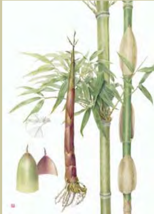
Keiko Fujita: Semiarundinaria fastuosa , Aquarell

Botanische Kunst aus Europa und Japan aus Vergangenheit und Gegenwart