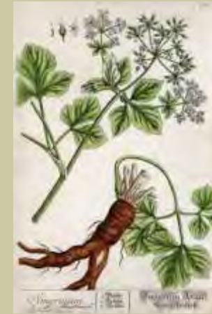
Elisabeth Blackwell: Smyrnium, Kupferstich