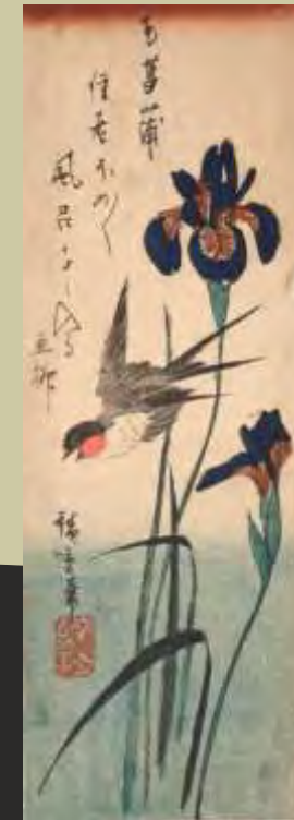
Hiroshige: Iris und Vogel, Holzschnitt und Tusche