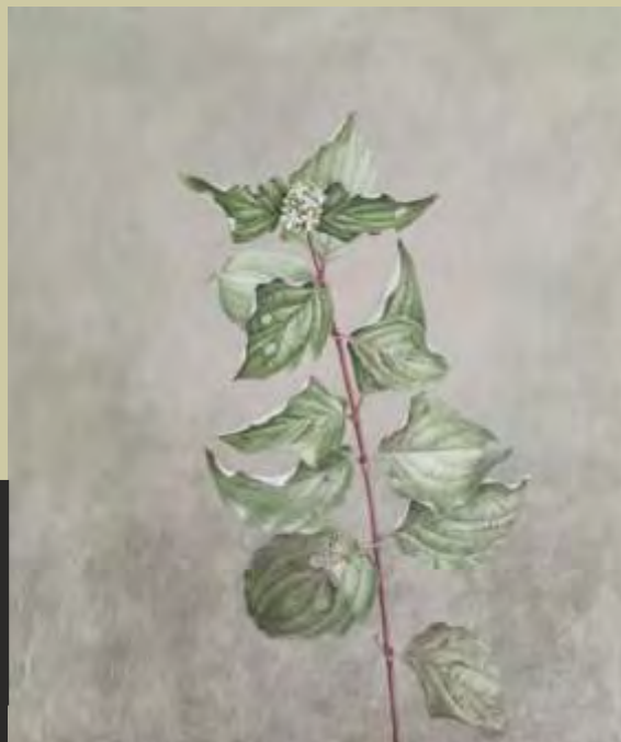
Sylvia Peter: Hartriegel , Acryl auf Holz

Die Ausstellung wird ermöglicht durch die Kooperation von: