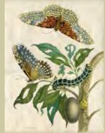
Maria Sibylla Merian, Surinambuch Tafel 20, Kupferstich