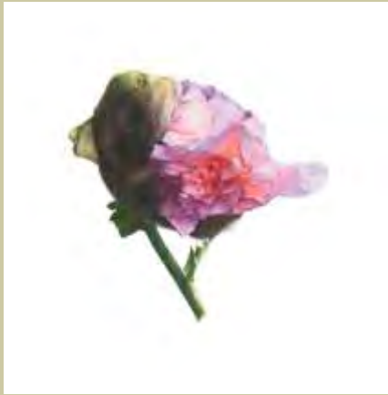
Fiona Strickland: Oriental poppy, Aquarell

In Aquarell und Zeichnung, Druckgrafik, Gemälde, Skulptur, Fotografie und Installation nähern sich die Künstlerinnen und Künstler der Pflanzenwelt. Feldstudien in vielerlei Art werden seit Jahrhunderten betrieben und treiben auch in unserer Zeit atemberaubende Blüten. Manche Künstler*Innen greifen wissenschaftliche Anordnungen und Illustrationsmethoden auf. Andere spüren den Feinheiten von Aderstrukturen und Oberflächen nach. Der Einfluss des Lichtes auf die Pflanzen wird in vielen der Arbeiten deutlich.