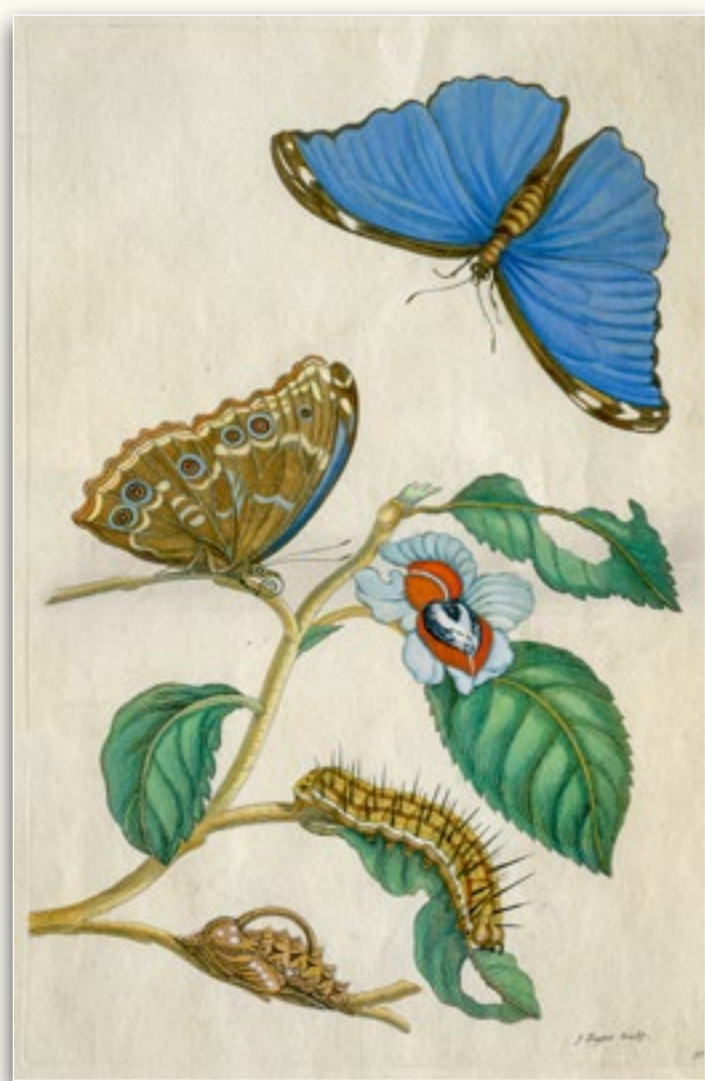
Original Kupferstiche aus dem Surinambuch von 1705, Bildformat ca. 26,5 x 39cm