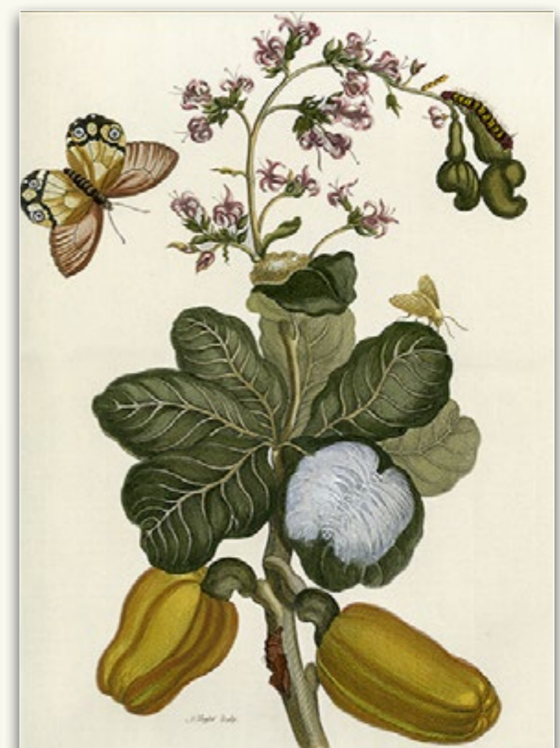
Maria Sibylla Merian Original Kupferstiche aus dem Surinambuch von 1705, Bildformat ca. 26,5 x 39cm