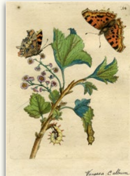
Original Kupferstich, Raupenbuch von 1679, Bildformat ca.12 x 16cm Johannisbeere 400,- €